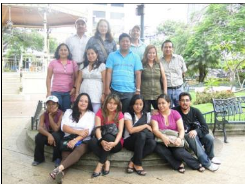
Participants (Equateur, janvier 2011)

Concrètement, 16 participants rassemblés en 3 groupes de travail ont pris part à ce programme, chacun abordant un projet qu'il voudrait réaliser.