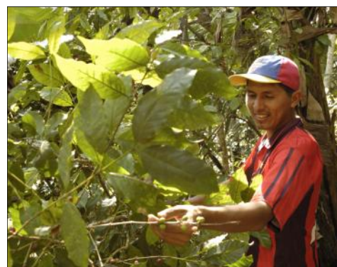
Galo de la Upocam explique la culture du café

Sa mission ? La défense des droits des paysans et de la souveraineté alimentaire. A la fois, elle promeut une agriculture organique et diversifiée, et offre à la population paysanne de sa région différents services de base (unité éducative à distance, accès aux soins de santé, défense des droits des paysans, ...).