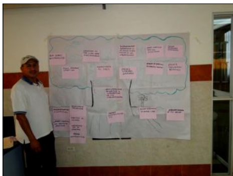
Méthode de l'arbre à problèmes