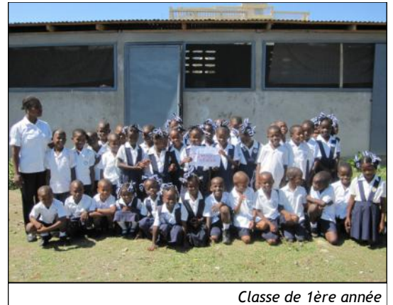
Classe de 1ère année

Située au nord de Haïti, à 280 km de Port-au-Prince, l'Ecole Normale de Vaudreuil forme, depuis 30 ans, de jeunes instituteurs. Sur le constat frappant du manque de structures scolaires par rapport au nombre d'enfants présents dans la région (6000 enfants dénombrés pour 4 établissements ne pouvant chacun accueillir que 300 enfants), la Communauté religieuse des Filles de Marie a décidé de mettre en place une école primaire, liée indirectement à l'Ecole Normale existante.