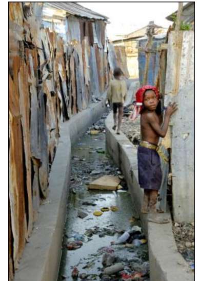
Cité Soleil

Après avoir prouvé ses bonnes intentions et son honnêteté, Jean-Luc Princen a pu à nouveau s'intégrer dans les allées de « Cité Soleil ». Même si les conditions de sécurité étaient parfois incertaines, Jean-Luc Princen a été touché par l'hospitalité et la générosité de la population du bidonville.