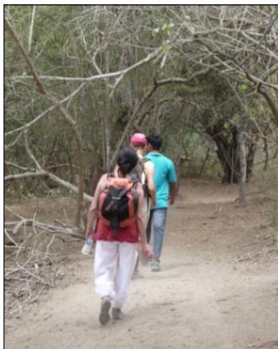
Découverte de la forêt sèche

de tourisme propre, la conception d'un site internet, la participation aux foires touristiques et l'élaboration de feuillets promotionnels.