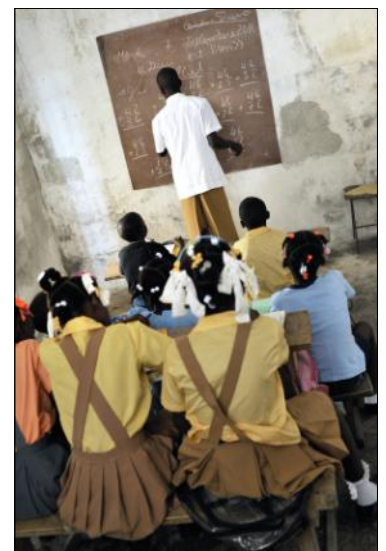
Salle de classe

En parallèle, l'Ecole des Amis de la Nouvelle Jérusalem continue à se développer. Elle dispose maintenant de bancs en bois réalisés par des artisans et d'une classe pour l'école maternelle. Des fonds restent néanmoins nécessaires pour rémunérer les enseignants et pour assurer leur travail d'encadrement, de protection et de sensibilisation.