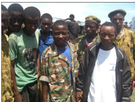
Démobilisation - Front National pour la Libération

Entre 1993 et 2008, l'Armée nationale de la République du Burundi était en guerre contre la rébellion de plusieurs groupes armés. Tout au long de cette période, des enfants ont été recrutés et enrôlés comme soldats, aussi bien par l'Armée nationale que par les groupes armés. Selon l'UNICEF, ils étaient estimés entre 6000 et 8000 en 2004. Leurs tâches étaient variées: porteurs, informateurs, femmes des soldats ou combattants réels.