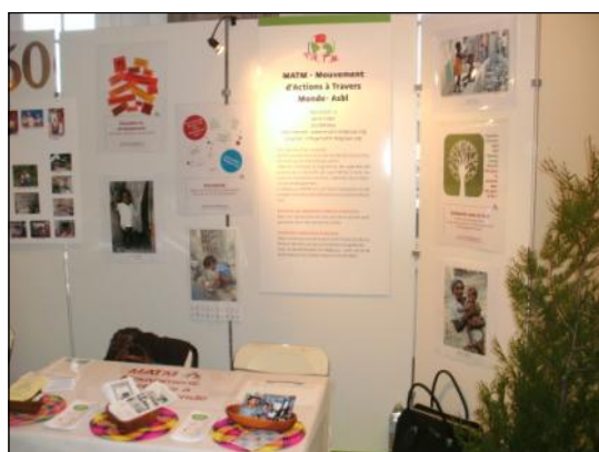
Stand de présentation de l'activité de MATM

Dans le cadre de l'année européenne du volontariat, MATM faisait partie des 110 associations rassemblées, au mois de février, au Salon du Volontariat à Liège. Au total, 4000 visiteurs se sont pressés pour venir découvrir les offres des différents organismes présents.