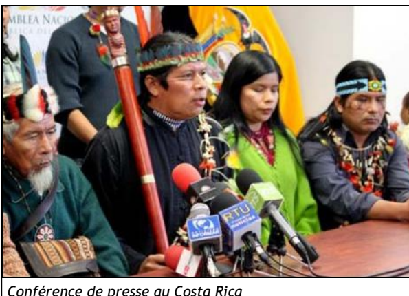
Conférence de presse au Costa Rica

En juin, vous avez été nombreux à soutenir le combat du Peuple Kichwa de Sarayaku en permettant l'envoi d'une délégation de 20 personnes devant la Cour Interaméricaine des Droits de l'Homme au Costa Rica.