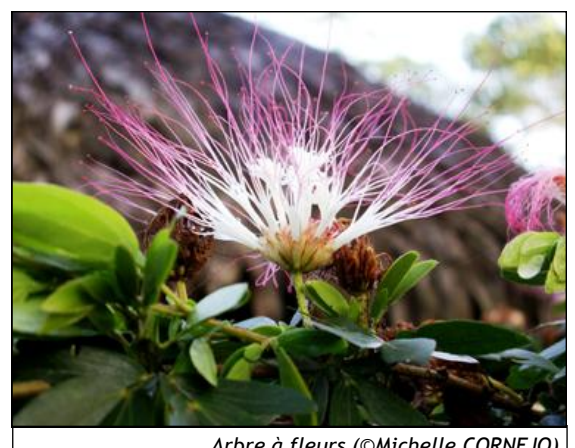
Arbre à fleurs

Face à l'incursion des compagnies pétrolières dans la forêt amazonienne, le peuple kichwa de Sarayaku mène une lutte pacifique pour défendre son territoire et ses terres sacrées. Leur résistance se manifeste par la création de la « Frontière de Vie » (Sisa Ñampi) qui incarne la matérialisation d'une vision d'un Yachak (chamane), symbolisant la nécessité de protéger la Forêt, vivante et sacrée.