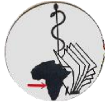
Centre de Promotion de la Santé

Les chiffres parlent d'eux-mêmes et la santé en RDC s'exprime au travers de statistiques alarmantes. D'une part le pays est fortement touché par le VIH (jusqu'à 10% de la population sexuellement active) et d'autre part l'espérance de vie dépasse rarement les 50 ans. Quant à la natalité, elle y est importante mais les naissances ne se déroulent pas toujours dans des conditions optimales. 13% des accouchements sans assistance médicale sont mortels pour la mère, alors que la présence d'une infirmière qualifiée permettrait à beaucoup d'enfants de ne pas finir orphelin.