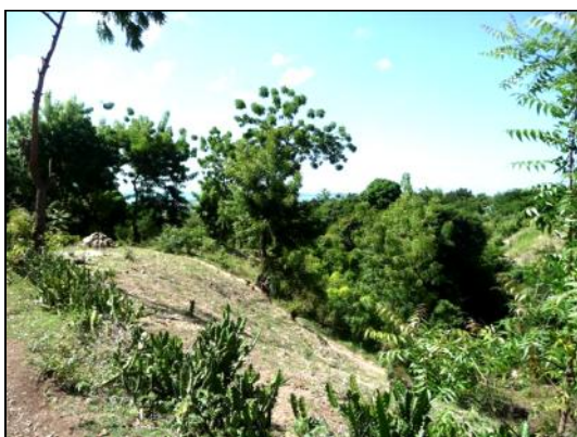
Aquin: zone partiellement déforestée

L' agroforesterie est une pratique traditionnelle d'exploitation du sol existant depuis des siècles sur tous les continents. Il s'agit d'un système d'association entre les arbres, les cultures, l'élevage et/ou la production de fourrage, parfois même l'apiculture. Cette technique est particulièrement adaptée aux pays tropicaux et subtropicaux, où les sols sont fragiles et où la main d'œuvre est principalement familiale. Les avantages environnementaux et économiques sont multiples : meilleure utilisation de l'espace, amélioration des caractéristiques physiques, chimiques et biologiques des sols, lutte contre l'érosion, limitation de l'utilisation d'intrants chimiques, variété de produits et de services (bois, fruits, fourrage, paisance...), etc.