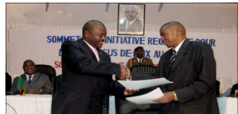
Nkurunziza et Rwasa

En décembre 2008, le gouvernement et les FNL ont accepté de lever les ultimes obstacles qui empêchaient la mise en œuvre d'un cessez-le-feu. Quelques mois plus tard, le 18 avril 2009, le chef des FNL, Agathon Rwasa, a rendu les armes et mis un terme définitif au conflit.